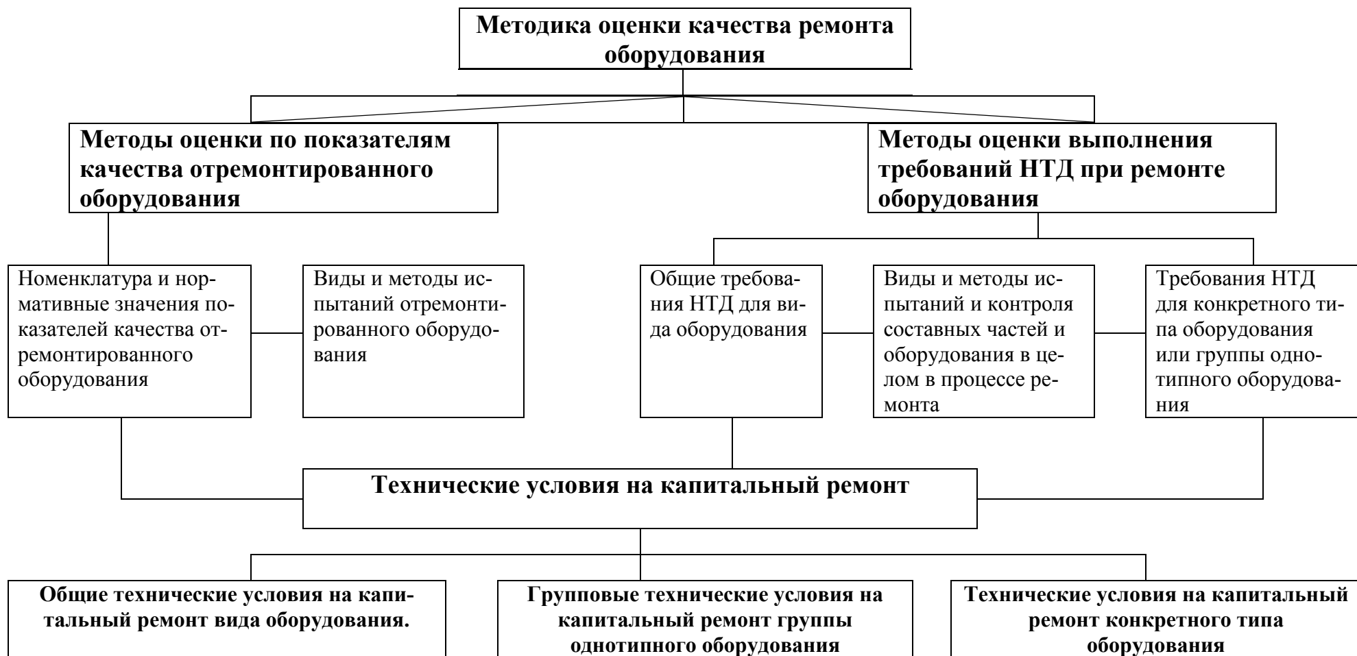
Рисунок 2 Структурная схема состава методики оценки качества ремонта оборудования электростанций